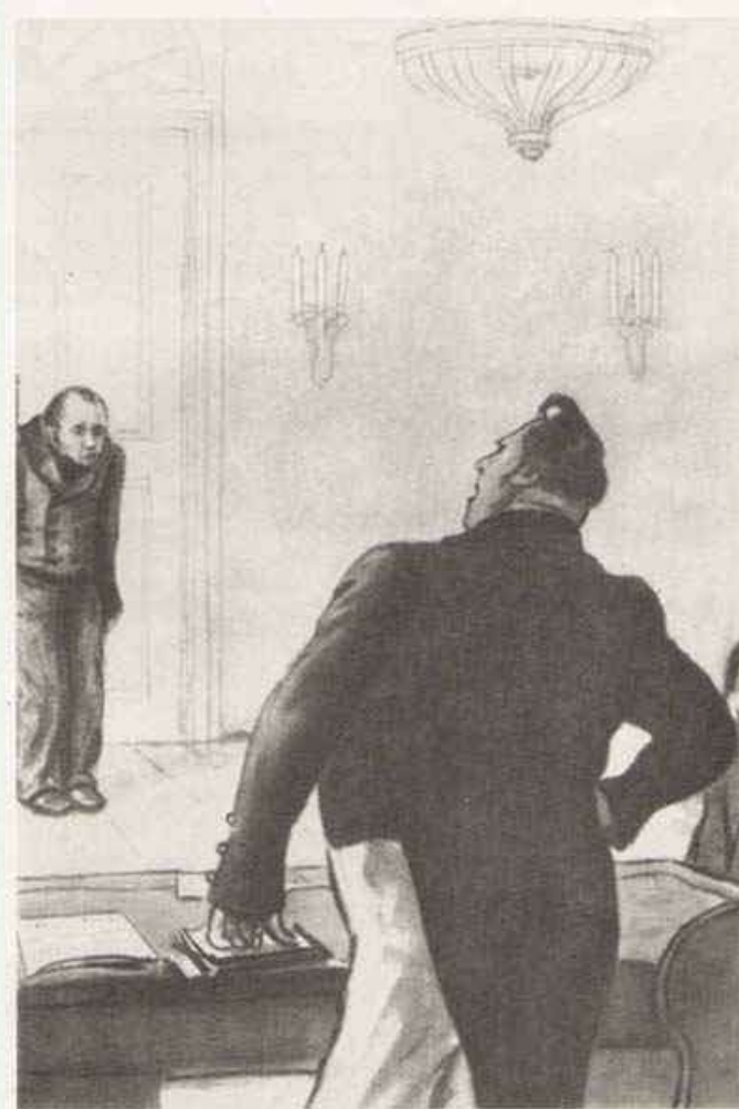
71. Акакий Акакиевич у значительного лица Художники Кукрыниксы, 1952 г., б., черная акварель