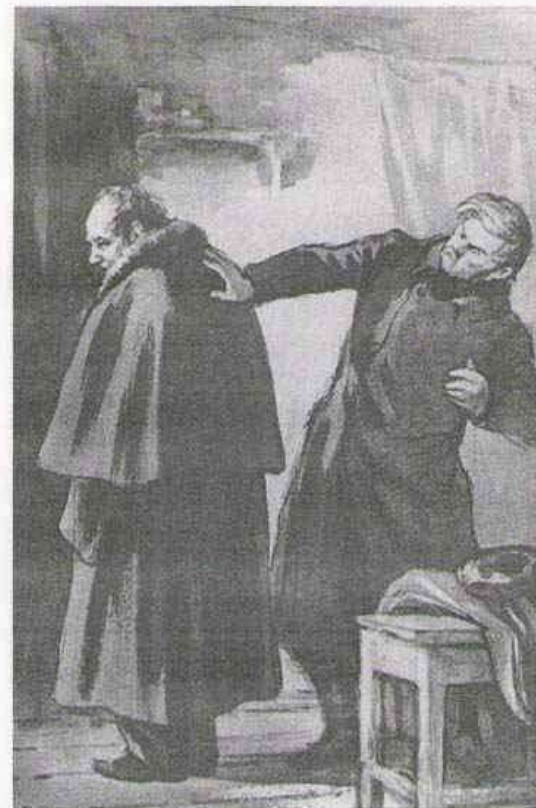
70. Акакий Акакиевич примеряет новую шинель Художника Кукрыникова, 1952 г., б., черная акварель

Шинель для Акакия Акакиевича не роскошь, а выстраданная необходимость. Приобретение шинели расцветчивает его жизнь новыми красками. Это, казалось бы, унижает его, но то, на что он идет ради этого, меняет всю привычную “систему координат” в нашем сознании. Он с каждого “истрачиваемого рубля откладывал по грошу в маленький ящичек”, кроме этой экономии он перестал пить чай и зажигать свечи по вечерам, а, идя по мостовой, наступал на цыпочки, “дабы не истереть подошвы”... Еще он, приходя домой, сразу снимал белье, чтобы не изнашивалось, и сидел в ветхом халате. Можно сказать, он ЖИЛ мечтой о новой шинели.