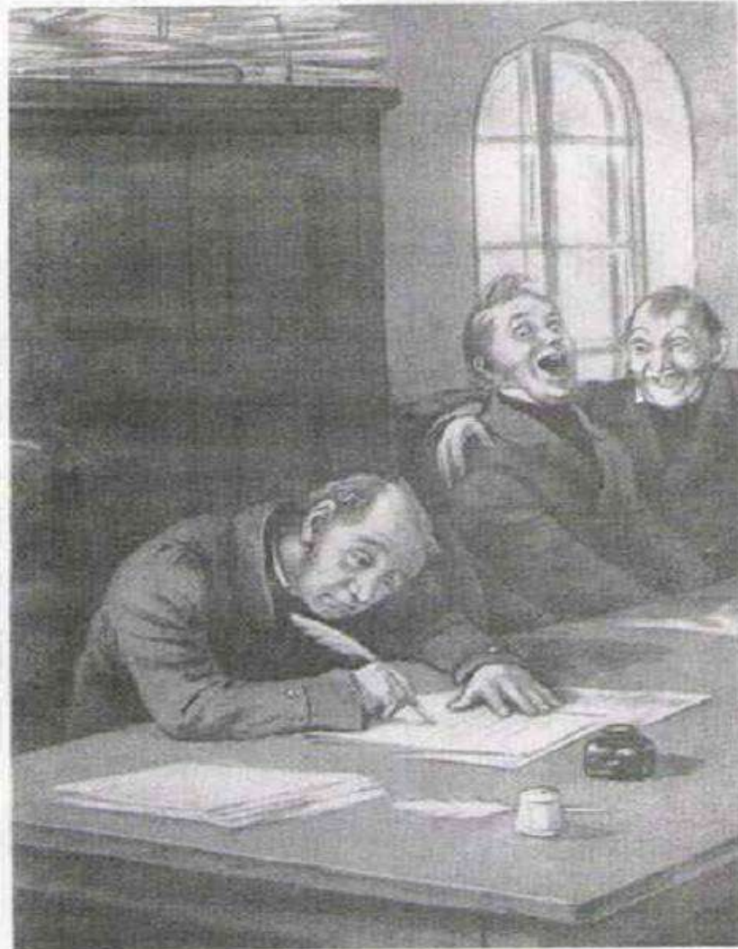
69. Акакий Акакиевич в департаменте