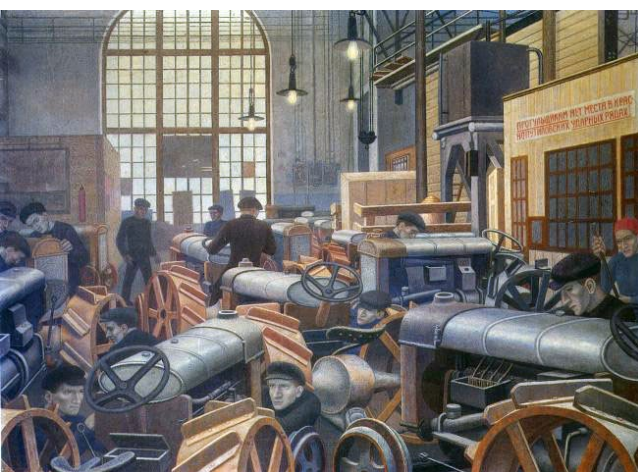
Тракторный цех Путиловского завода. П.Н.Филонов. 1932.

О значимости тех или иных событий начинаешь понимать не после чтения страниц учебника, а после того, как попадутся на глаза воспоминания простых очевидцев. Сухие строчки учебника говорят, как тяжела была жизнь рабочих Путиловского завода, живущих за Нарвской заставой. А после революции их жизнь кардинально изменилась в лучшую сторону.