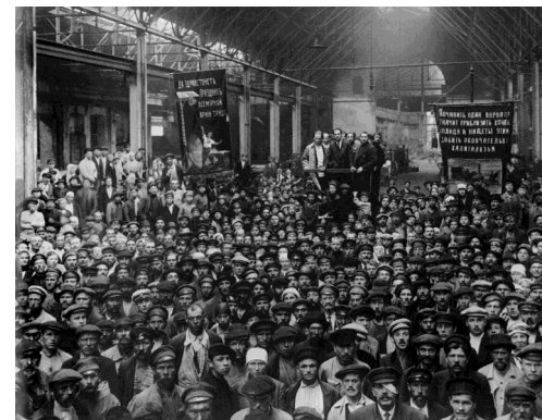
1920. Рабочие Путиловского завода.

постоялых дворов с кабаками, 10 церквей и только один кинематограф и дощатый Путиловский театр. За все годы работы на Путиловском заводе (а это 18 лет до революции) автор воспоминаний только раз выбрался в театр. «Вся наша жизнь была театром ужаса, - пишет он, - спасала только молодость». Читая эти строки, понимаешь, что революция произошла не случайно, слишком плохо и тяжело жили люди.