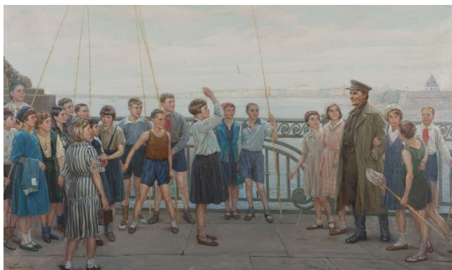
Фрагмент картины Платунова, М.Г. Киров среди пионеров. Холст, масло (1937)

Кругом только и слышно: «Киров то, Киров сё. А что то-сё?» Вот и узнаем.