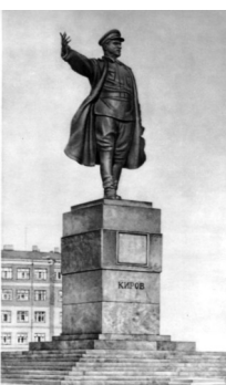
Памятник С.М. Кирову, открытка 50-х гг

Память о С. М. Кирове была увековечена во многочисленных памятниках и топонимах. Один из памятников находится в нашем районе на Кировской площади у здания Кировского райсовета. На всесоюзный конкурс на памятник, объявленный в 1935 году, было представлено около 200 проектов. Памятник был сооружен в рекордные сроки, за 5 месяцев, 6 декабря 1938 г. открыт.